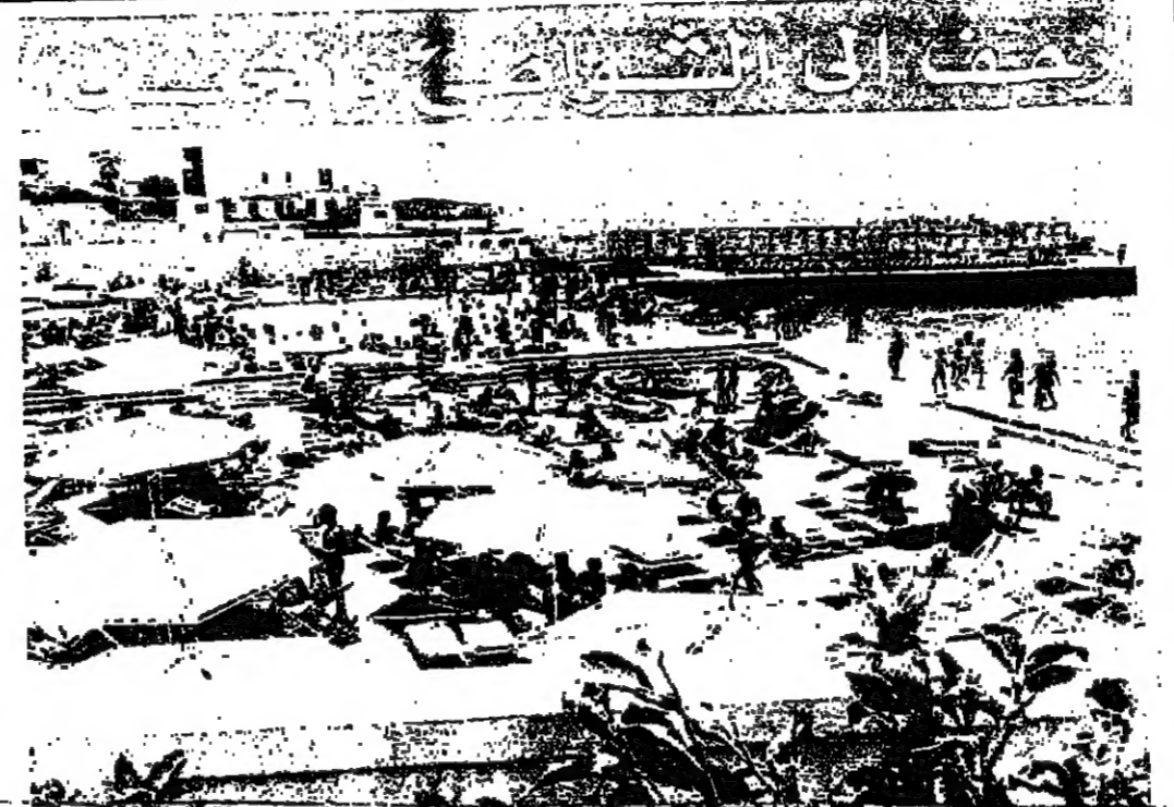
خشد من السليحين في أحد مواقع بيروت أمس

أعلن ساحة التمام الصدر في مؤتمر صحفي عقده مساء أمس في بيروت، قيام حركة "أفواج المقاومة اللبنانية" بهدف صد اعتداءات العدو بالجنوب. وقال أن أهداف هذه الحركة ضد الاعتداءات الإسرائيلية على الجنوب، ودعا الجنوبيين من مختلف الطوائف إلى الانضمام إليها، وكره مطالبته بوضع سلاح جيب الميشتات في مؤسسة حكومية منها للاقتبال بين المواطنين. وقال التمام الصدر في المؤتمر الذي حضره الشيخ رياض طه أن الحادث المرعب قرب بعلبك أمس الأول، وقع في مركز ترويب للحركة، وادى إلى مقتل ٢٦ شخصا وإصابة ٢٢ بجرح. وقال التمام الصدر مؤثرا بالقول: "وإذا اتهمنا العدو بقتله، فإننا نطالبه بالاعتذار، ونحن نطالبه بالاعتذار، ونحن نطالبه بالاعتذار". وقال التمام الصدر مؤثرا بالقول: "وإذا اتهمنا العدو بقتله، فإننا نطالبه بالاعتذار، ونحن نطالبه بالاعتذار".